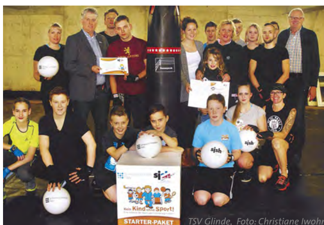
TSV Glinde