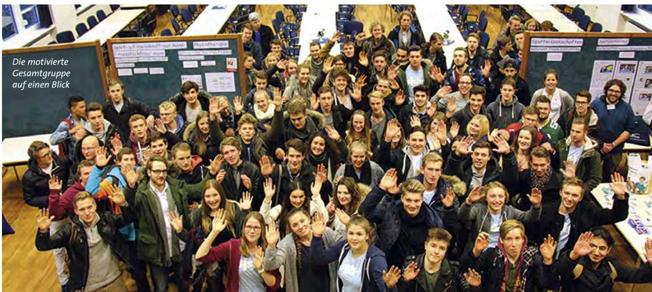
Die motivierte Gesamtgruppe auf einen Blick