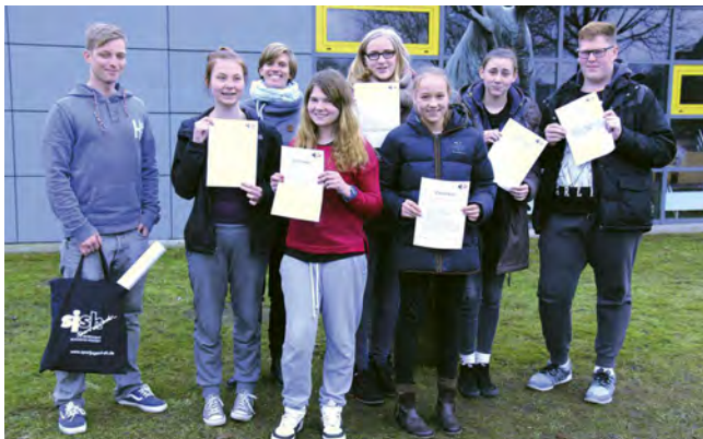
Absolventen der Juleica Ausbildung der Grund- und Gemeinschaftsschule Schacht-Audorf