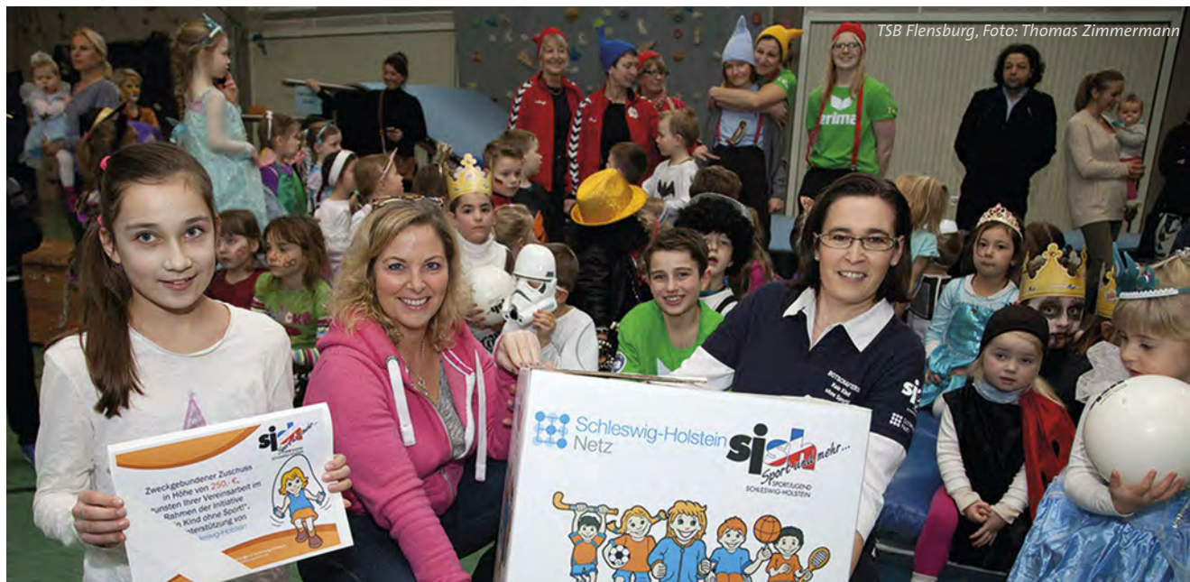
TSB Flensburg

Mit dem TSV Glinde und dem TSB Flensburg können sich erneut zwei Sportvereine in unserem Land über ein Starter-Paket „Kein Kind ohne Sport!“ freuen. Die Sportjugend Schleswig-Holstein und die Schleswig-Holstein Netz AG überreichen den beiden Vereinen im Rahmen von örtlichen Veranstaltungen jeweils ein Starter-Paket, um diese für deren außerordentliches Engagement zugunsten sozial benachteiligter Kinder auszuzeichnen.