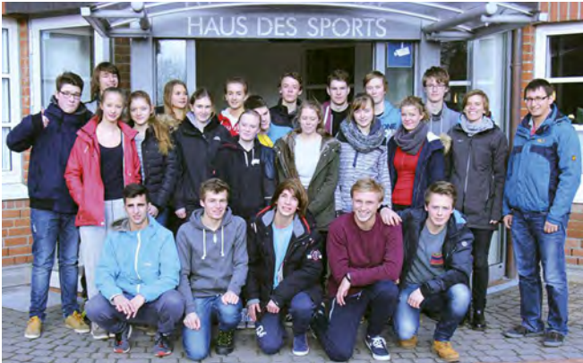
Das Gymnasium Plön beim Besuch des Haus des Sports

Grundschule durch. In diesem Zuge wurden die wichtigsten Aspekte in den Bereichen Teamarbeit, Aufgabenteilung und Organisation vermittelt. Das Projekt der SchülerInnen lief außerordentlich gut, sodass sie mit Spaß und einer persönlichen Weiterentwicklung aus der Juleica-Ausbildung hinausgehen. Die Ergebnisse der Evaluation zeigen, dass die Juleica-Ausbildung in der Schule generell gut ankommt, aber noch weiter konzeptionell angepaßt werden muss.