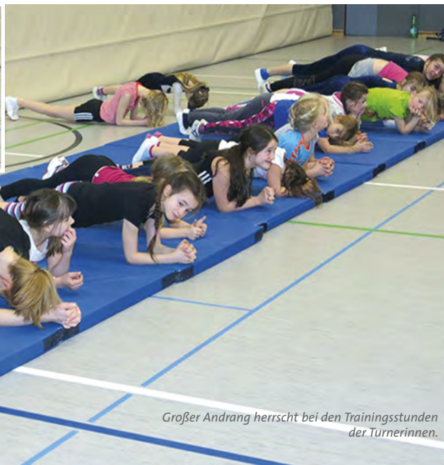
Großer Andrang herrscht bei den Trainingsstunden der Turnerinnen.