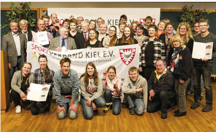
Glückliche Preisträger im Haus des Sports: Mit dem Peter Petersen Preis wurden engagierte Sportler und Vereine ausgezeichnet – damit verbunden ist eine finanzielle Förderung ihrer Arbeit.