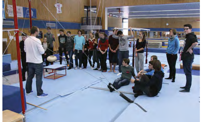
Gymnasium Plön beim Besuch des Leistungsturnzentrum Kiel

Das zweite Modellprojekt fand in Kooperation mit dem Gymnasium Plön und dem angegliederten „Schüler Ruder- und Segelverein Plön e.V.“ statt. Nach ihrem Auftakt in der Projektwoche besuchte die Gruppe die sjsh im Haus des Sports und bekam Informationen über verbandsspezifische Themen. Als Abschluss besuchten die Jugendlichen das Leistungsturnzentrum