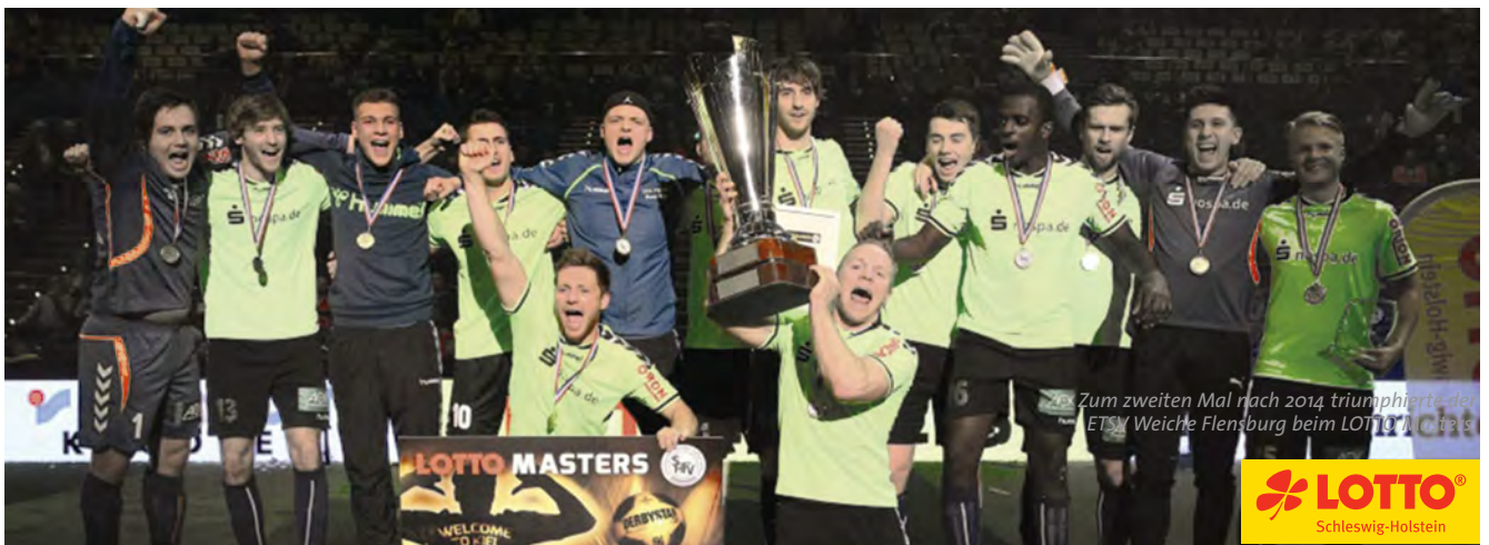
Zum zweiten Mal nach 2014 triumphierte der ETSV Weiche Flensburg beim LOTTO Masters.