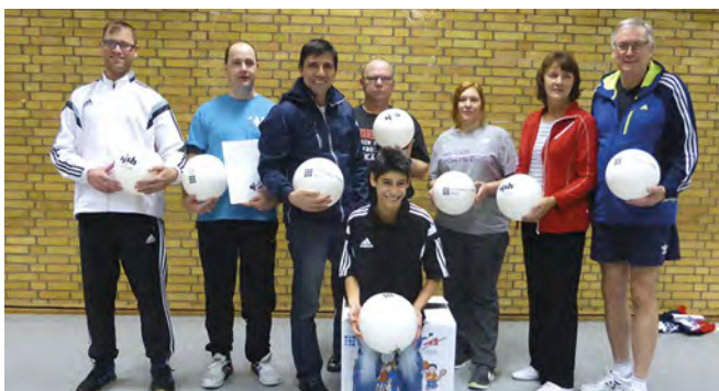
1. Kieler Gesundheits- und Rehasportverein

Beim Pinneberger Tennisclub hat man bereits im Jahr 2012 eine Schul-AG für Kinder und Jugendliche mit geistiger Behinderung ins Leben gerufen. Unter Anleitung lizenzierter Trainer können die teilnehmenden Schülerinnen und Schüler ihre Koordination und ihre Geschicklichkeit trainieren. Dabei gehen die Kinder wöchentlich ihrer Begeisterung an der Bewegung und ihrer Tennisleidenschaft nach. Die dafür benötigte Tennisausrüstung sowie die anleitenden Trainer stellt der Verein kostenfrei zur Verfügung. Auf diese Weise können immer wieder interessierte junge Menschen in den regulären Trainings- und Spielbetrieb integriert werden. Darüber hinausgehend werden die Kinder und Jugendlichen auch durch verschiedene Angebote aktiv in das Vereinsleben eingebunden. Beispielsweise können sie an vereinsinternen Turnieren, Tenniscamps und weiteren Veranstaltungen teilnehmen.