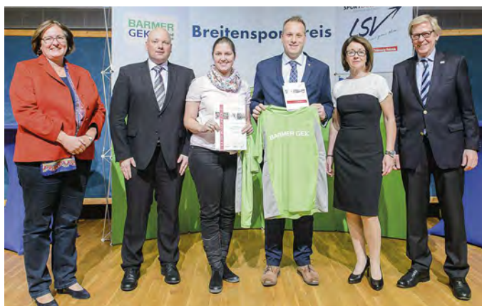
SV Tungendorf Neumünster

Neben zahlreichen Sportkursen gibt es im SVT-Sportzentrum seit einiger Zeit Englischkurse für Senioren, in denen die Teilnehmerinnen und Teilnehmer in Grund- und Aufbaukursen die Fremdsprache erlernen können. Mit dem bilingualen Kinderturnen hat der Neumünsteraner Großverein bereits seit Jahren von sich reden gemacht. Nun nutzt er bewusst die Kompetenzen seiner qualifizierten Übungsleiter und bietet den zahlreichen Seniorinnen und Senioren im Verein Sprachkurse ohne Leistungsdruck und mit viel Spaß an. Hintergrund dieser Maßnahme ist, dass gerade die älteren Frauen und Männer das Motto ihres Vereins bewusst erleben können: „Vielmehr als nur ein Sportverein“.