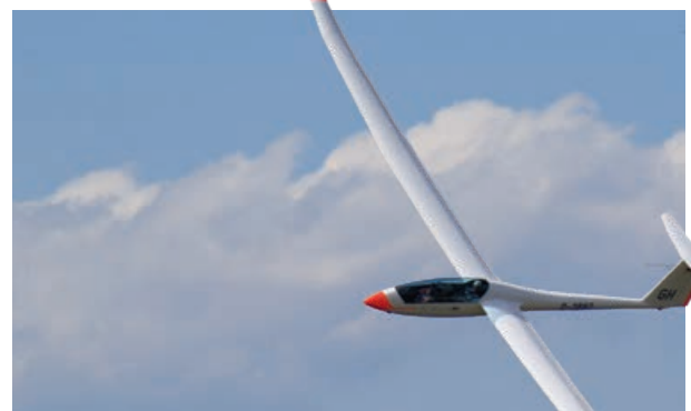
Im Segelflug gilt es, die Thermik zu erkennen, die auch den Vögeln „nebenan“ zum Auftrieb dient.