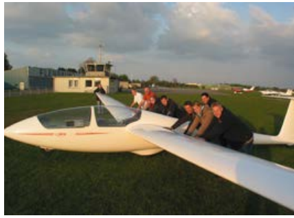
Segelfliegen, wie hier bei einer Großveranstaltung des Luftsportvereins Flensburg, ist Sport in Gemeinschaft, weil auf dem Flugplatz alle Hände gebraucht werden.