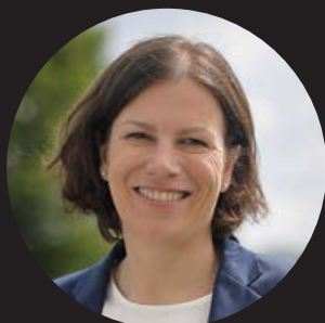
Kristina Herbst Präsidentin des Schleswig-Holsteinischen Landtages

„Grenzen auf der einen Seite zu überwinden und auf der anderen Seite auch zu akzeptieren... verbunden mit einem wunderbaren Glücksgefühl, wenn ersteres der Fall ist.“