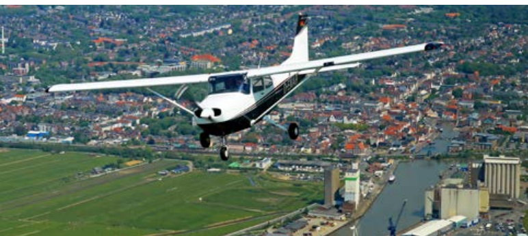
Motorflug mit einer Cessna der Sportfluggruppe Husum: Stadt und Land und Wattenmeer aus der Luft im Blick.

Immerhin, die Zahlen sind stabil. Der Verband mit seinen 25 Vereinen verzeichnete zum 1. Januar 2023 eine Mitgliederzahl von 2448. Das ist zwar im Vergleich zum Vorjahr (2545) ein Minus von 3,81 Prozent. 2009 waren es jedoch auch schon 2429. Segel- und Motorflieger machen dabei rund 70 Prozent der Mitglieder aus. Der Rest verteilt sich auf Disziplinen wie den Modellflug, Ultraleichtflug oder den Fallschirmsport. Allerdings: Nur 195 Mitglieder von den 2448 sind Kinder und Jugendliche. Ein alarmierender Anteil von lediglich acht Prozent. Auch der Frauenanteil liege, so Claus Cordes, im einstelligen Prozentbereich. „Es dauert natürlich, bis man als Jugendlicher im öffentlichen Verkehrsraum fliegen darf. Und viele Jugendliche