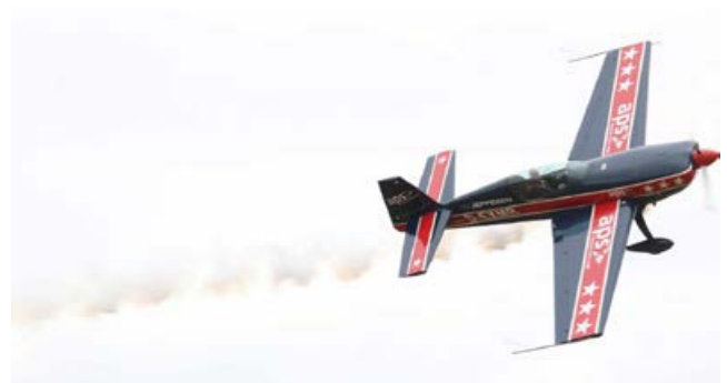
Kunstflug zur Einweihung der neuen Landesgeschäftsstelle mit Trainingszentrum auf dem Flugplatz Schachtholm bei Rendsburg. Der Neubau wurde vom LSV gefördert.