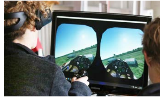
An zwei Simulatoren mit VR-Brille des Luftsportverbandes kann heute jeder effektiv die Grundlagen des Segel- und Motorflugs erlernen oder Gelerntes auffrischen. Motion Seats sind bestellt, damit auch alle Bewegungen des Flugzeugs erlebbar sind. Der Dank gilt dem Landes-sportverband, der das Projekt gefördert hat.

umgehen diese Frustration, Computerspiele sind bequemer“, so Cordes. Auch der Mittelbau „zwischen ganz jung und ganz alt fehlt uns aus familiären und finanziellen Gründen.“