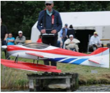
Modellflug hat in Schleswig-Holstein schon Weltmeister hervorgebracht. Hier ein stattliches Wasserflugzeug, das aus dem Gewässer startet und dort auch wieder landet.