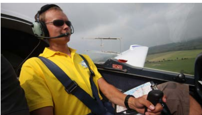
Im Motorflug die Luftfahrtkarten für die Navigation auf dem Kniebrett – und den weiten Blick über Schleswig-Holstein genießen.